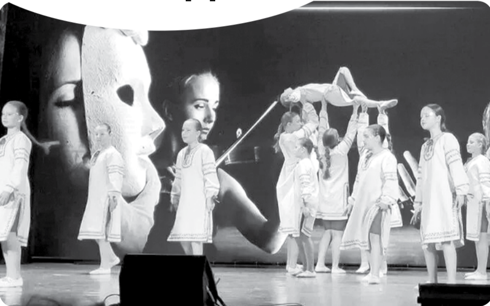
Хореографическая студия «Dance mix» на фестивале-конкурсе «Искусство длиною в жизнь»