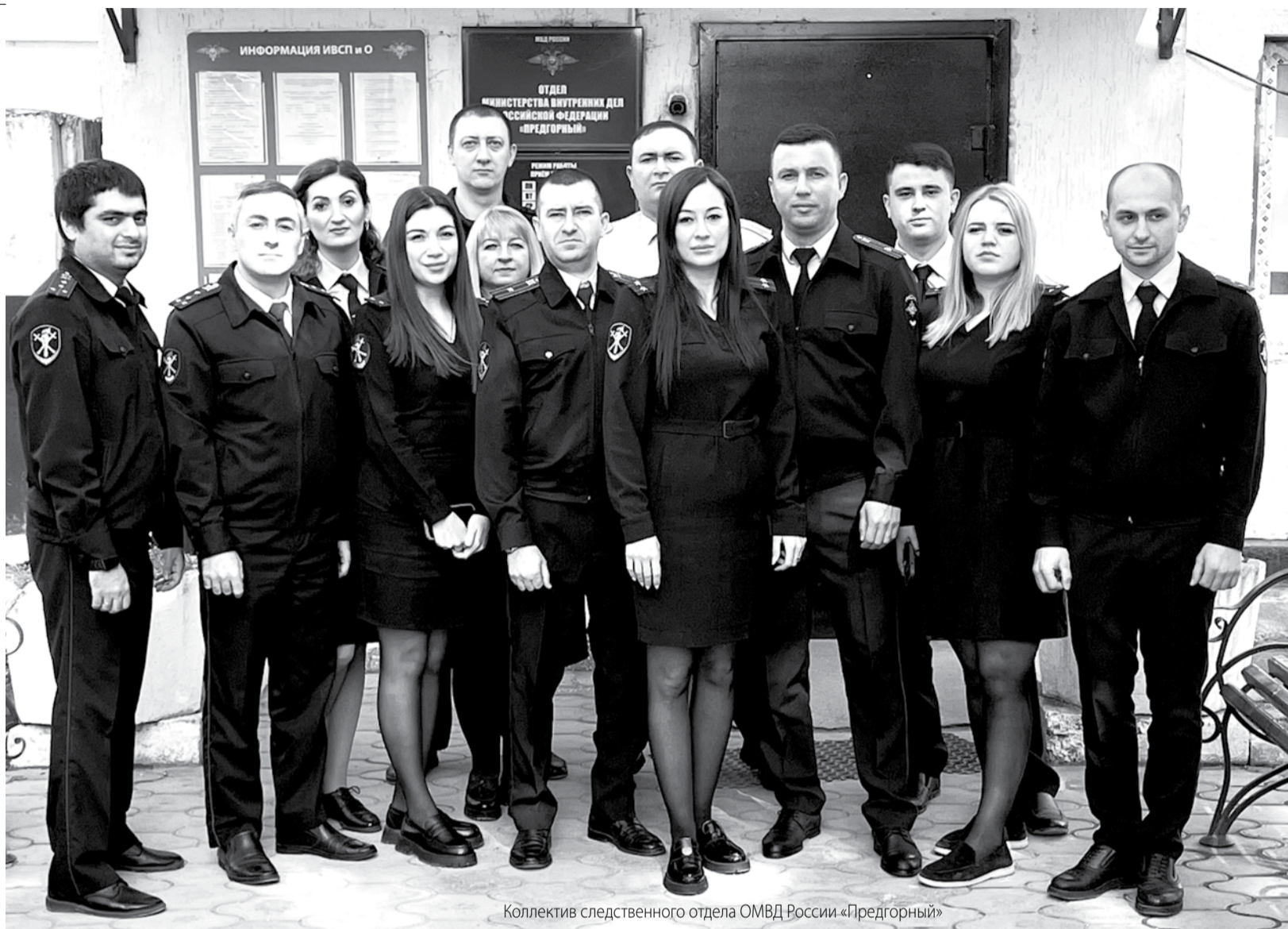
Коллектив следственного отдела ОМВД России «Предгорный»

лективе следственного отдела, каких-либо резонансных уголовных дел, которые окончены СО Отдела МВД России «Предгорный»?